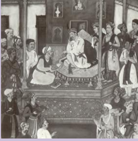
चित्रम् - ७ अबुल-फज्जलः अकबरनामां स्वीकुर्वन् अकबरः

अकबरः स्वस्य घनिष्ठमित्रं राजसभासदम् अबुलफज्जलं च आदिष्टवान् यत् सः तस्य शासनकालस्य इतिहासं लिखेत् । अबुल-फज्जलः एतम् इतिहासं त्रिषु खण्डेषु लिखितवान् तस्य शीर्षकं च अस्ति अकबरनामा इति । प्रथमे खण्डे अकबरस्य पूर्वजानाम् उल्लेखः अस्ति अपरः खण्डः अकबरस्य शासनकालस्य घटनानां विवरणं ददाति । तृतीये खण्डे आइने-अकबरी इति अस्ति । एतस्मिन् अकबरस्य प्रशासनस्य, राजकुटुम्बस्य, सेनायाः, राजस्वस्य, साम्राज्य-भूगोलस्य च वर्णनं लभ्यते । एतस्मिन् समकालिकभारतस्य जनानां परम्पराणां संस्कृतीनां च विस्तृतं वर्णनम् अस्ति । आइने-अकबरी इत्यस्य रोचकतरः पक्षः विविधप्रकारस्य वस्तूनां सस्यानाम् उत्पादनस्य मूल्यानां पारिश्रमिकस्य राजस्वस्य च साङ्ख्यिकीयं विवरणम् अस्ति ।